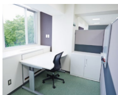
ブースオフィス 2,000円/月

【利用期間】 コース6ヶ月間。 スペースは原則、24時間365日利用が可能です。 ※詳しいご利用条件はお問合せください。