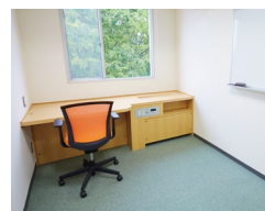
個室 (小) 約9㎡ 4,000円/月