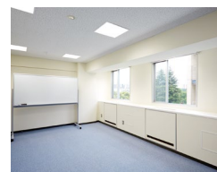
個室 (中) 約28㎡ 8,000円/月