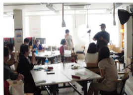
立川ツクールは明るく素敵な空間。