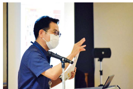
馬込ビジネスコーチが熱弁します