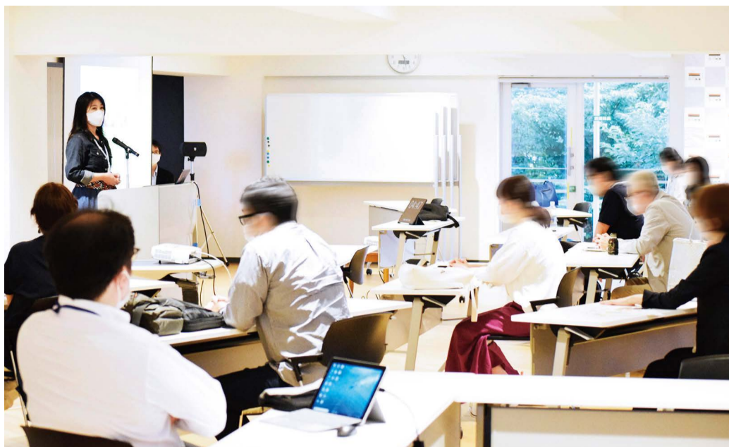
ビジネスを卒業していく会員のプレゼンシーン

創業ゼミナール 創業準備コース第12・13・14期卒業 & 第20・21・22期入会記念 2020年7月17日(金)