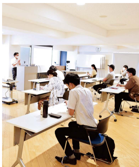
経営のスリム化を真剣に学ぶ参加者

BusiNestでは、入念な新型コロナウイルス感染症対策を講じた上で、創業者本位のイベントやセミナーを開催していきます。(馬込)