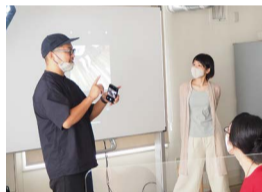
丁寧な説明に参加者は興味津々。