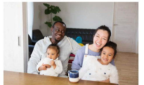
マイホーム購入をストーリーのある写真や動画で演出

人生の分岐点であるマイホーム購入、その家族の新しい出発に対して、撮影サービスを提供する事により住宅の付加価値を高め「この地域に住んで良かった！」と思っただけの環境作りや、マイホーム購入のお手伝いを目的とし、それら各家庭の特別の物語を、写真や動画でストーリー的に演出していきます。