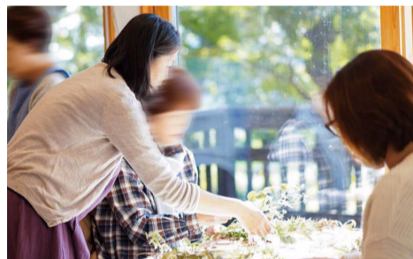
大人気のワークショップ (上) 滝田氏が制作した作品 (下)

そして、制作時等にあまる素材や作品に使えなくなった小さな素材を「こぼれ花」として、手作りを