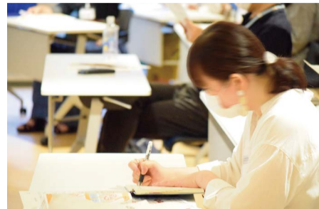
参加者は真剣にメモをとっていました

7月17日(金)にBusiNest創業ゼミナールを開催しました。この催しは「創業者が集い、学び、高め合う場」としてBusiNestが定期的に行うもので、コロナ禍の影響で9ヶ月ぶりとなった今回は、卒業された会員の活動発表、新たに入会された会員の自己紹介でした。