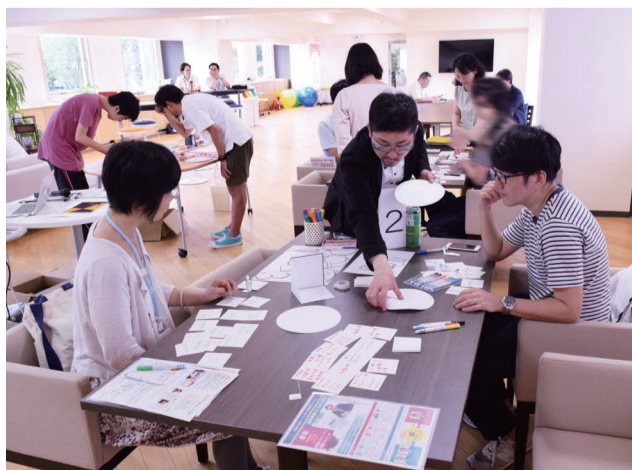
創業ゼミナールで行われた「画用紙ビジネスラボゲーム」の様子

Q 上の写真のように? そう!! この写真が全てを表しています。キャンパスライクな雰囲気も感じただけのBusiNest。少しでも創業という文字が頭に浮かぶ方はぜひ一度お越しください!!