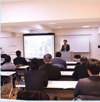
1月度創業ゼミナール セミナールームでの様子

4月19日(金) 17:00～19:00 (開場 16:45) 会場: BusiNest 3F セミナールーム