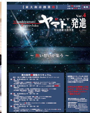
恒例の「ヤマト DE 発進」ポスター