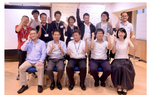
合宿で成長を実感。メンター陣と一緒にガッツポーズ!

これから来年2月末までの6ヶ月間、メンターからの助言や、毎月のデモ(進捗発表会)でのディスカッションを通じて、試行錯誤しながら、事業を加速させていきます。これから2月まで参加チームがどれくらい成長するのか非常に楽しみです! (井上/記)