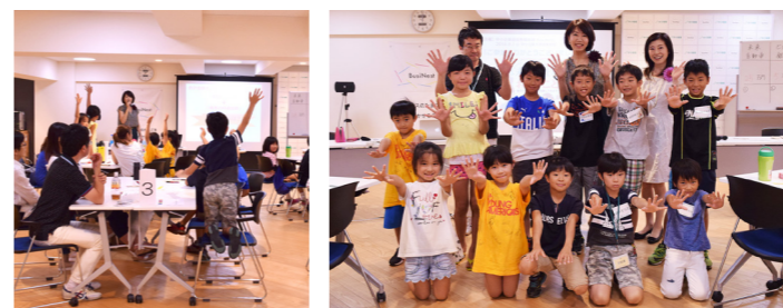
みんな活発に手が挙がります! 子どもたちも株が学べて大喜び!

【お金】と【仕事】について親子イベントを開催しました。学校では教えてくれない“株”について株式会社ができるまでの歴史を学びニュースによって変動する株価を予想した株取引ゲームを楽しみました。本物そっくりのおもちゃの一万円札が会場内行ったり来たり。普段あまり株に興味がないお母さんも「子どもと一緒に“株”の仕組みを学ぶことが出来ました」と大好評でした。（堀江/記）