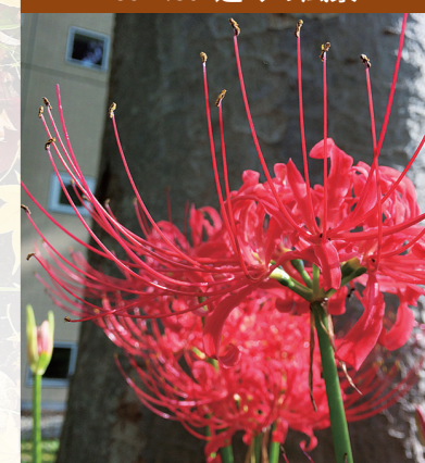
9月中旬、ビジネスト前の中庭に彼岸花が咲きました。季節の花を仕事の息抜きに見てみてはいかがでしょうか。