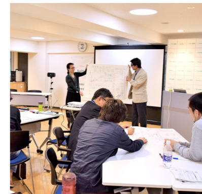
真剣に課題に取り組む受講生たち