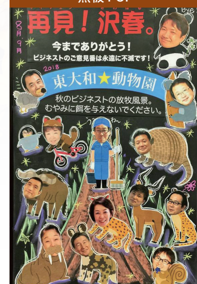
8・9月の黒板POPはBusiNest 東大和動物園! さすがの飼育員もこれだけの個性ある動物にタジタジの様子…。