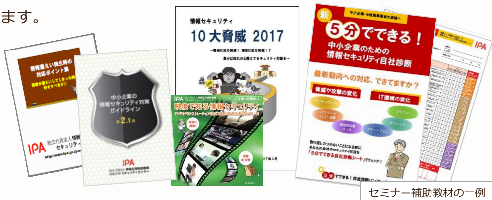
セミナー補助教材の一例

中小企業が情報セキュリティ対策を実施・支援する際に必要な、実践的な知識を学んでいただくために、全国各地で無料セミナーを開催します。